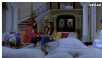
Pamosties līdzās. Serijs (7+) ▶ Nedzirdīgajiem Šodien