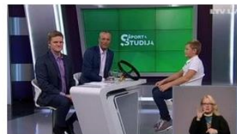
Sporta studija ▶ Nedzirdīgajiem Vakar