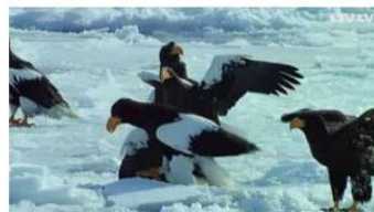
Eksotiskās salas 2. Dokumentāla daudzsēriju filma ▶ Nedzirdīgajiem Šodien