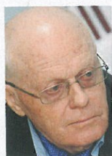
VALDIS BIRKAVS Būvniecības attīstības stratēģiskās partnerības valdes priekšsēdētājs, bijušais premjers

Koalīcijas padome izlemj no partiju viedokļa, turpretī slēgtā valdības sēdē, kurā piedalītos tikai ministri, būtu jālemj no valsts viedokļa